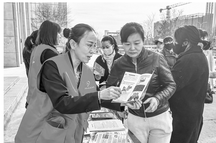
为切实帮助辖区失业人员及时掌握最新就业创业政策，提升就业创业能力，近日，东安社区组织开展就业再就业政策宣传活动。

服种种困难为妻子四处求医问药，坚持记录“护理日记”，以实际行动演绎了“执子之手与子偕老”。