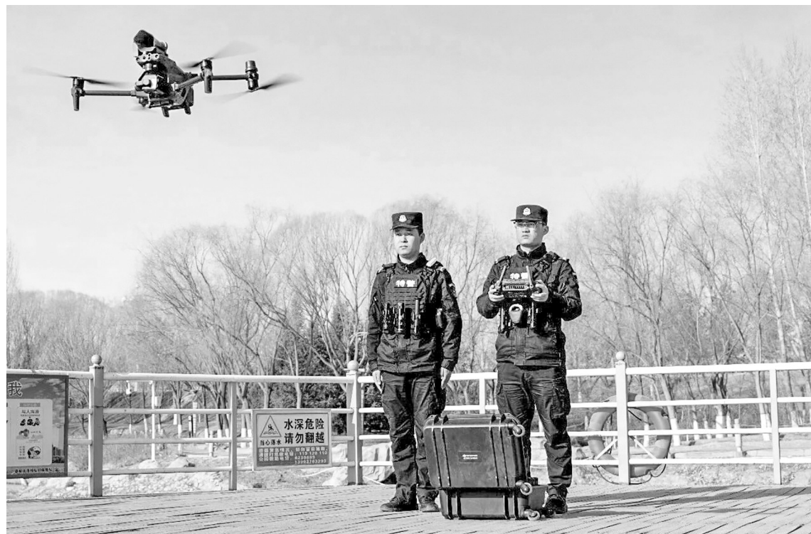
市公安局坚持智慧赋能提升精准防控效能。