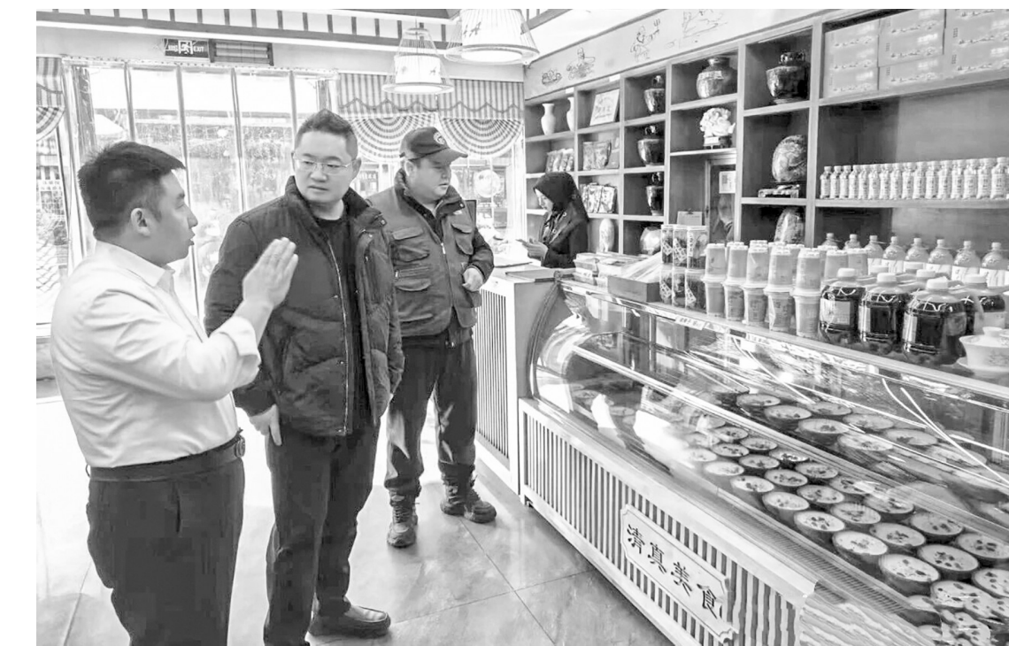
近日，朝晖社区组织开展“九小场所”安全生产宣传排查专项行动，全力织密安全防护网。

市图书馆将持续优化服务功能，推出更多阅读福利与文化服务，不断完善线上服务体系，以更贴心、更高效的公共文化服务，增强读者的获得感与满意度，推动全民阅读深入开展。