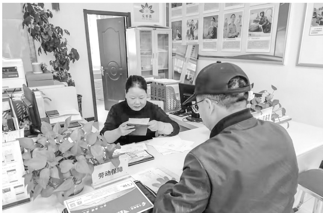
为进一步做好就业困难人员社保补贴工作，让国家优惠政策落到实处。近日，佳苑社区积极开展灵活就业社保补贴办理工作。