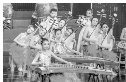
鼓乐合奏《金蛇狂舞》