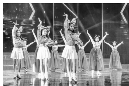
流行歌曲联唱《追光·声生不息》