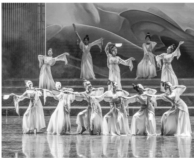
古典舞《一脉风华盛世春》